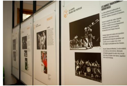
Panneaux sur La danse prisme des peuples .