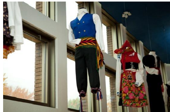
Costume québécois, costumes portugais féminin et masculin.