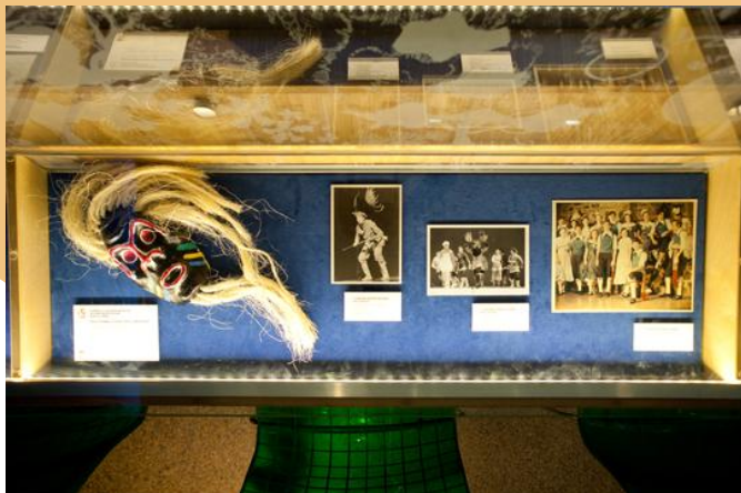
Masque du chasseur-Paskola (La Danza del Venado, peuple Yaqui, Mexique), photos de La Shakapoine (Métis). Photo : Josée Lecompte

En fonction d'un découpage thématique et dans une approche ethnohistorique, l'exposition évoque les origines de ces danses, visant à ce que le visiteur s'imprègne des récits sous-jacents. De façon universelle, les gens dansent pour interpréter le monde vivant, pour raconter une histoire, pour transposer une légende, pour vouer un culte, pour s'amuser ou encore pour célébrer des événements significatifs de leur vie. Les danses folkloriques sont des prismes qui mettent en lumière la culture des communautés culturelles.