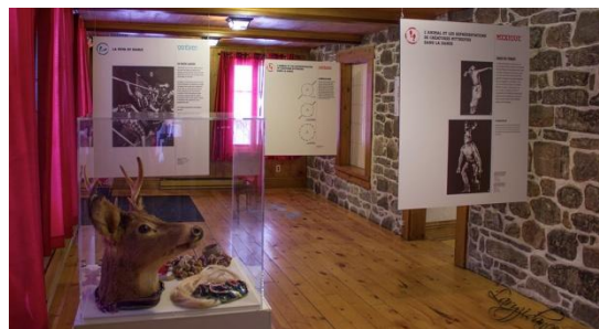
Vue partielle de l'exposition à la Maison Pierre-Chartrand, à Rivière-des-Prairies.